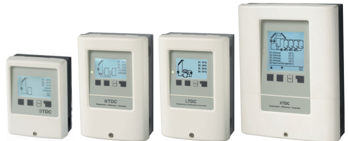
Controller Serie TDC