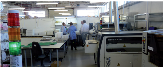
Elektronische Produktionslinie bei SOREL