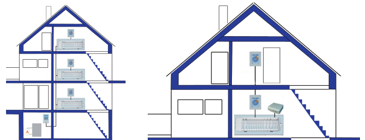
Anwendungsbeispiele °CALEON und °CALEONbox

Weitere Fotos und Material finden Sie hier www.sorel.de > Downloads> Medienmaterial oder über den folgenden Kontakt